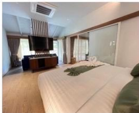
ห้องนอน Master - Bed king size