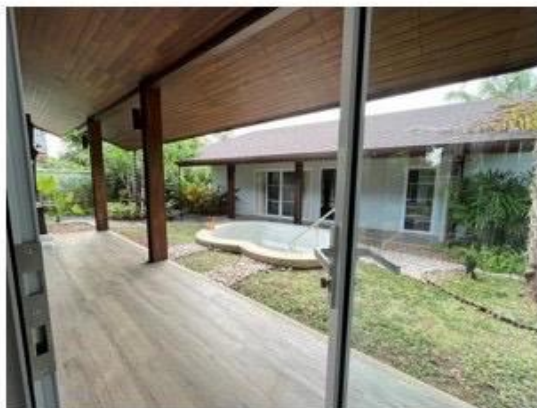
มุนพักผ่อนและแช่น้ำแร่ร้อนเค็ม