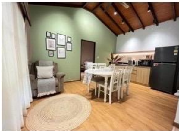
ห้องรับประทานอาหาร และ Mini bar