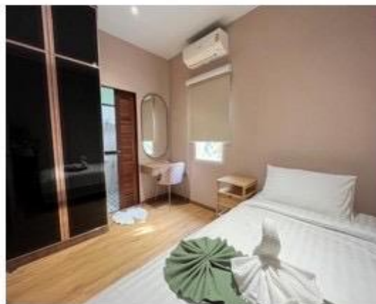
ห้องนอนเล็กมีห้องน้ำในตัว