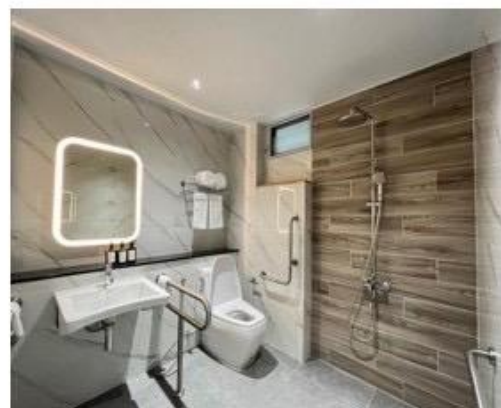
ห้องน้ำพร้อมเครื่องอำนวยความสะดวกครบครัน