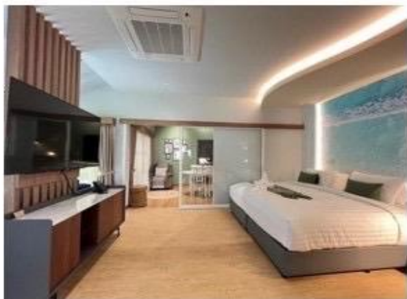
ห้องนอน Master - Bed king size