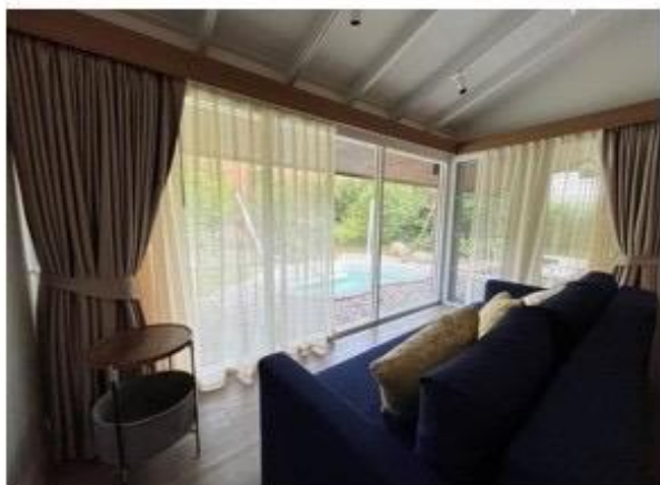
living room วิถีธรรมชาติ