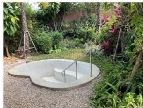
น้มน้ำพุร้อนและน้ำแร่พุร้อนเค็ม