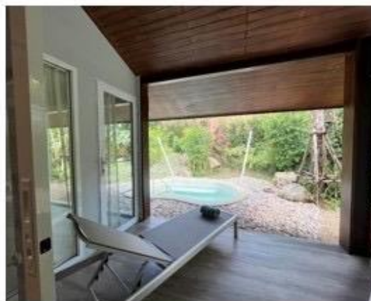
มุมพักผ่อนและบ่อน้ำแร่ร้อนเค็ม