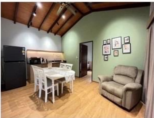
ห้องรับประทานอาหาร และ Mini bar