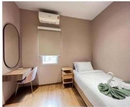
ห้องนอนเล็กมีห้องน้ำในตัว