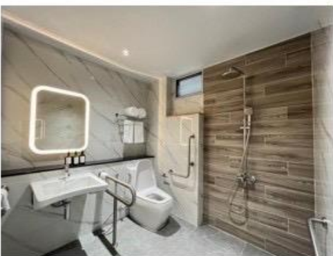
ห้องน้ำพร้อมเครื่องอำนวยความสะดวกครบถ้วน